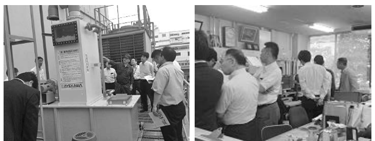
図3 NH 3 除外設備